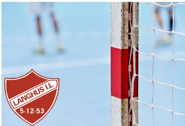
LANGHUS IL HÅNDBALL Alle nivåer - Alle årsklasser Flest mulig - lengst mulig

Sportslig Utvalg har igjennom året 2020 jobbet med den nye Sportslige Strategi plan.